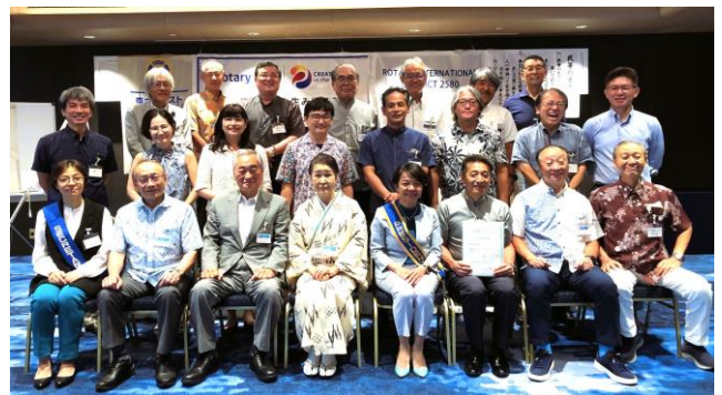
※8/24の例会にて。素敵なビジターゲストの皆様と共に！